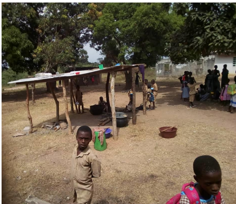
Cuisine de la cantine scolaire actuelle

La cuisine est inexistante et c'est un couvert de fortune qui fait office d'espace de cuisine. Aucun critère de sécurité et d'hygiène ne peut être ainsi assuré.